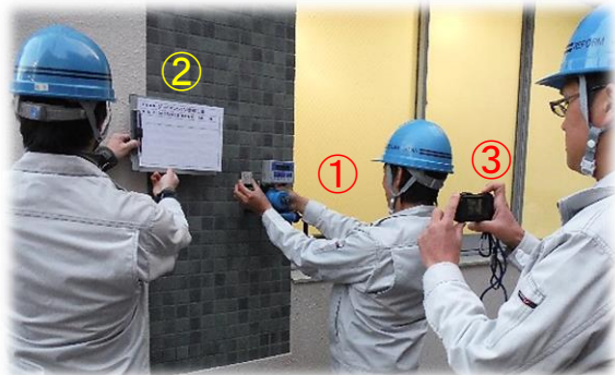
従来の撮影風景(作業員3名)