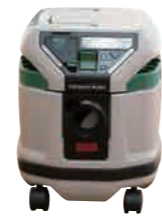
ピアダバキューム